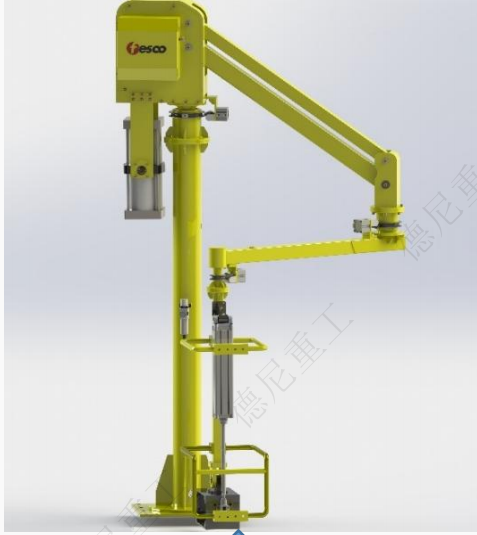
智能辅助提升设备