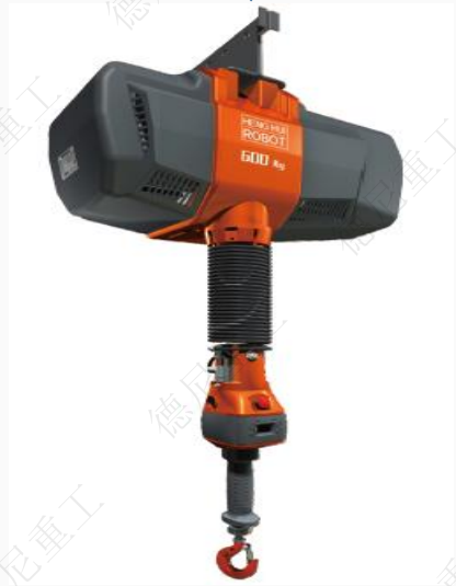
软索式助力机械手