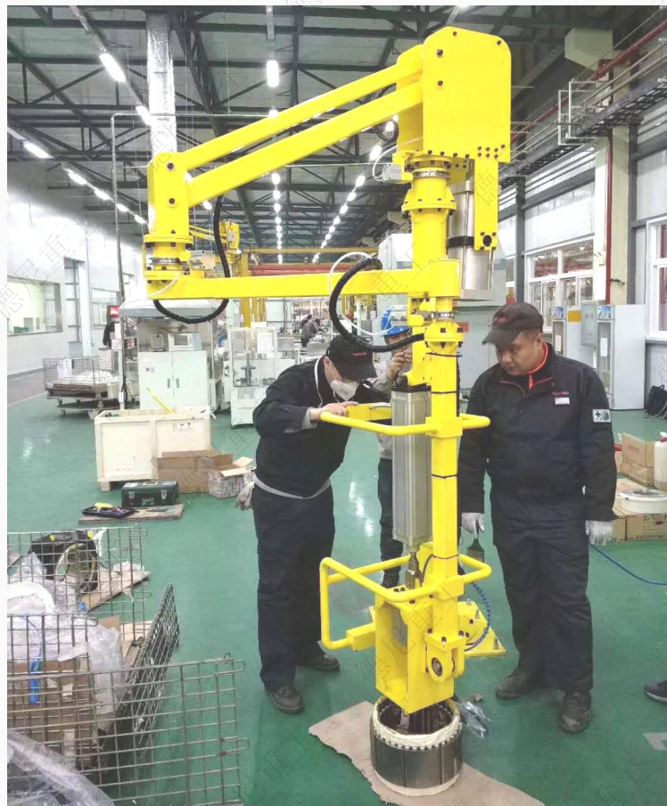
用户：东芝电梯（沈阳）有限公司 工件：电机定子 工作方式：内部夹取、地面固定、90° 翻转、360° 旋转平移 工作范围：R2700mm 工件重量：150KG