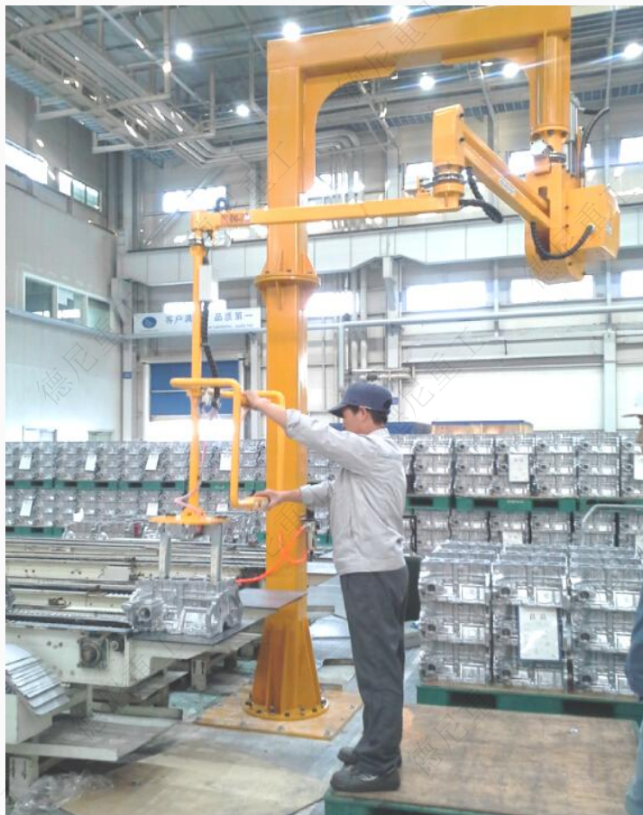
用户：现代汽车 工件：发动机外壳 工作方式：内部夹取、地面固定、360° 旋转平移 工作范围：R3000mm 工件重量：60KG